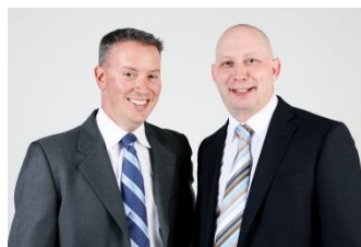
Geschäftsleitung der AMPS GmbH